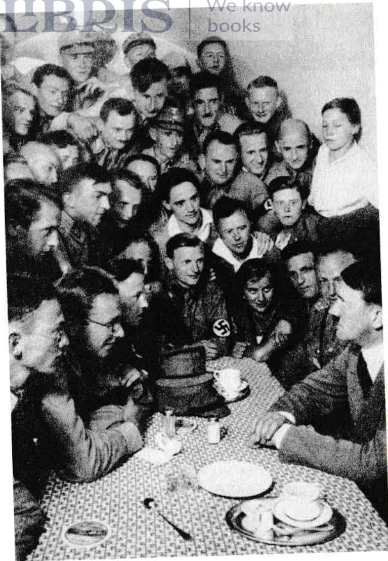
Această fotografie este emblematică pentru mașina de propagandă nazistă. Adulatorii lui Adolf Hitler caută în ochii lui Conducătorul, la puțin timp după ce a fost ales Cancelar al Germaniei, în 1933.